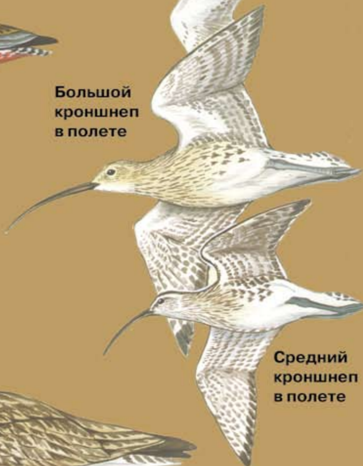
Средний кроншнеп в полете