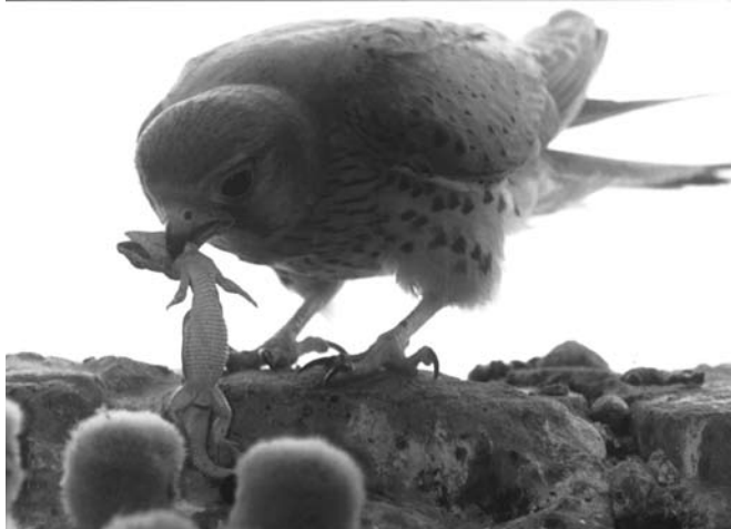
Пустельга на гнезде

Уже в мае пустельги нашли другое, весьма безопасное место для повторной кладки – в проеме чердачного окошка. Самочка часто покидала новое гнездовье, требовала еду у избранника. И тот приносил ей медведок, мышей, ящериц. В середине июня, вернувшись снова в больницу, я сходил в гости к новоселам. На высохшем голубином помете лежали 4 почти красных, в крапинку, яйца. Пятое яйцо – кремовое, с еле заметными «веснушками» – по форме не отличалось от остальных, но мне подумалось: вдруг подброшенное степной пустельгой? Но увы!