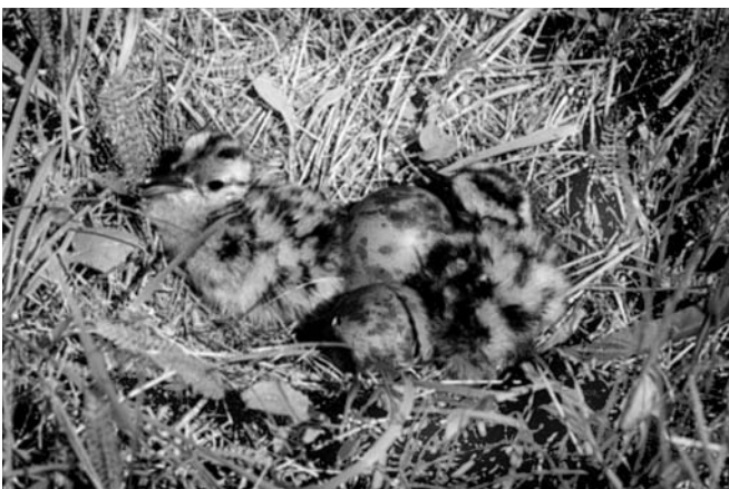
Птенцы большого кроншнепа.

Анализ поведения и кормов кроншнепов показал, что такая редкая форма клюва делает его удобным инструментом (типа пинцета), для сбора насекомых среди сравнительно густой, но невысокой травы. Поэтому и считается, что кроншнепы как группа сформировались в ходе эволюции в открытых травянистых ландшафтах, напоминающих современные степи. Позже некоторые кроншнепы приспособились к жизни в иных ландшафтах – на лугах, болотах, в тундре, кое-кто даже на полях. Длинный изогнутый клюв оказался удобным орудием