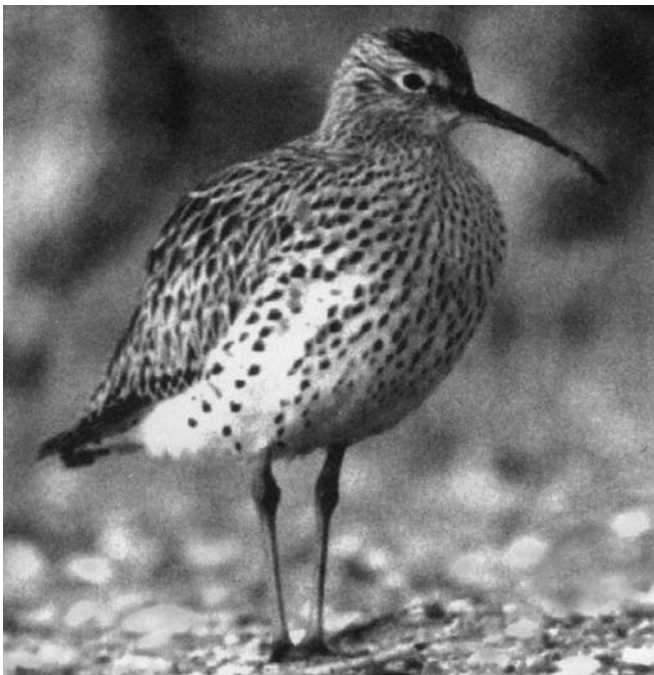
Тонкоклювый кроншнеп.

Благородное стремление сохранить тонкоклювого кроншнепа подогревалось желанием вновь отыскать места его гнездования. Однако сложности политической ситуации второй половины XX века, противоборство двух социальных систем и «железный занавес» ставили непреодолимое препятствие для орнитологов Запада в осуществлении эти планов. Советские же ученые были весьма пассивны и не предпринимали фактически никаких шагов для прояснения состояния вида и мест его гнездования. Налицо была абсолютная, если так можно выразиться,