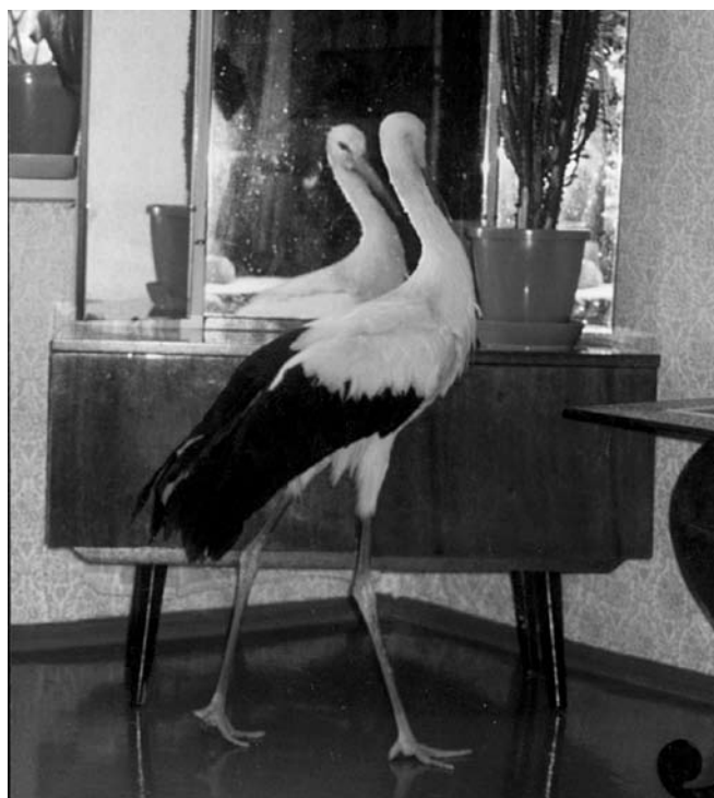
Аик перед зеркалом

До недавнего времени белые аисты встречались на территории Ярославской области лишь sporadично и имели статус залетного вида. Встречи с аистами были отмечены в 1855 и 1957 гг. А в 1985 г. в поселке Нагорный Переславского района был зарегистрирован первый достоверный факт их гнездования. И с тех пор началось постепенное освоение белыми аистами Ярославского края. На сегодняшний день в разных районах нашей области зарегистрировано более 20 гнезд этого вида, к большинству из которых птицы возвращаются из года в год. Однако вполне вероятно, что фактов гнездования аистов значительно больше. Практика гнездования аистов в Ярославской области показывает, что эти птицы предпочитают строить свои гнезда на водонапорных