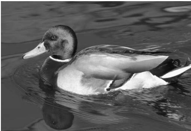
Селезень кряквы.

Как правило, парковые кряквы летом так же охотно принимали подачки от людей, как и зимой. Быстро обучаются этому и утята. Даже гоголи, обычно гордые и независимые, часто не отказывались от подкормки,