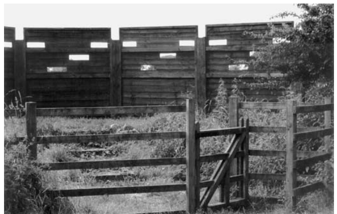
Забор-укрытие для наблюдений.