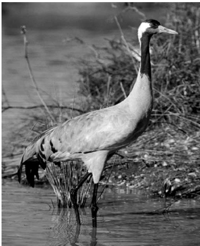
Одна шестая часть журавлей Соединенного королевства гуляет по болоту

Викен Фен – один из старейших природных резерватов Англии. Охраняемая более 100 лет заболоченная территория имеет общеевропейское научное значение, международное значение в соответствии с Рамсарской конвенцией об охране водно-болотных угодий. Звучит громко!