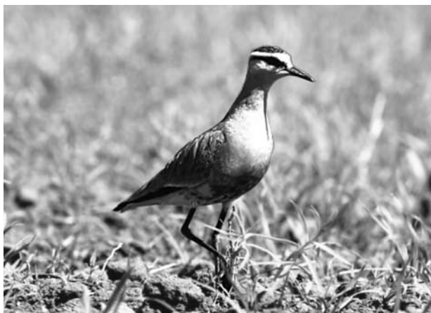
Кречетка (самка).

те. 30 видов занесены в Красные книги Российской Федерации и Оренбургской области, 11 из них относятся к видам, находящимся под глобальной угрозой, и включены в Красный список Международного союза охраны природы и природных ресурсов (это кудрявый пеликан, краснозобая казарка, пискулька, савка, белоглазый нырок, степной лунь, орлан-белохвост, степная пустельга, стрепет, кречетка, степная тиркушка). Уникальна колония кудрявого пеликана из