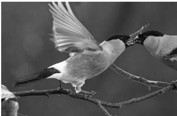
Выяснение отношений.

не отличаются от невзрачных самок, и только серые снегيري полностью лишены красного пигмента. Лишь в редких случаях самцы серого снегиря имеют слабый розовый оттенок, но это только издержки наследственности или индивидуальные особенности пищевых предпочтений. Кстати, именно рацион и является причиной появления яркой окраски в этой группе птиц. Пигментация перьев напрямую зависит от количества каротиноидов, присутствующих в корме.