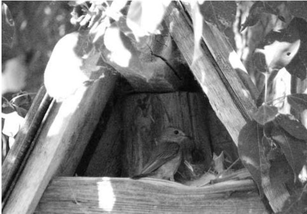
Гнездо серой мухоловки на старом туалете.

шей сарая. В 2007 г. одна пара свила гнездо под навесом у жилого корпуса. Птенцы вылупились 10 июня. Оба родителя постоянно носили им корм, почти не обращая внимания на присутствие людей. 27 июня все четыре птенца вылетели из гнезда. Вторая пара свила гнездо под крышей сарайчика недалеко от р. Жилетовки. 10 июня были замечены демонстрации ухаживания, включавшие в себя поочередное ношение строительного материала к гнезду. 16 июня самка закончила кладку из четырех яиц, 31 июня вылупились птенцы. Серые мухоловки гнездились на биостанции и в предшествующие годы. В холодном и сыром июне 2005 г. птенцы серой мухоловки, которая построила гнездо в старом гнезде деревянной ласточки над окном жилого корпуса, погибли – скорее всего, от голода и переохлаждения.