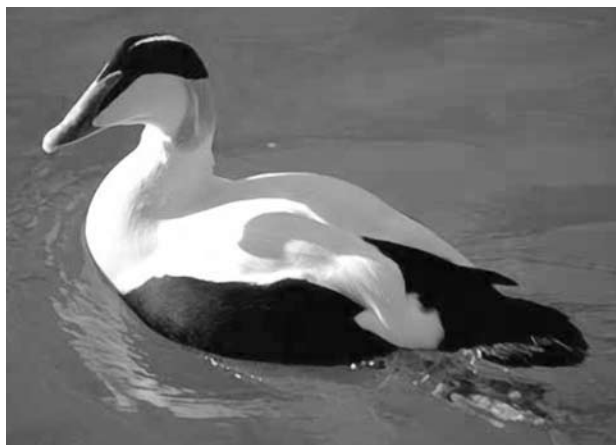
Обыкновенная гага (самец)

Гнездо строит самка, выбирая для этого максимально укрытое место: в расщелинах между камней, в густых кустах можжевельника или под низко стелющимися по земле ветвями елей. Самец не принимает участия ни в строительстве гнезда, ни в дальнейшем насиживании и вождении птенцов. Первое время после начала гнездования самцы кочуют у островов,