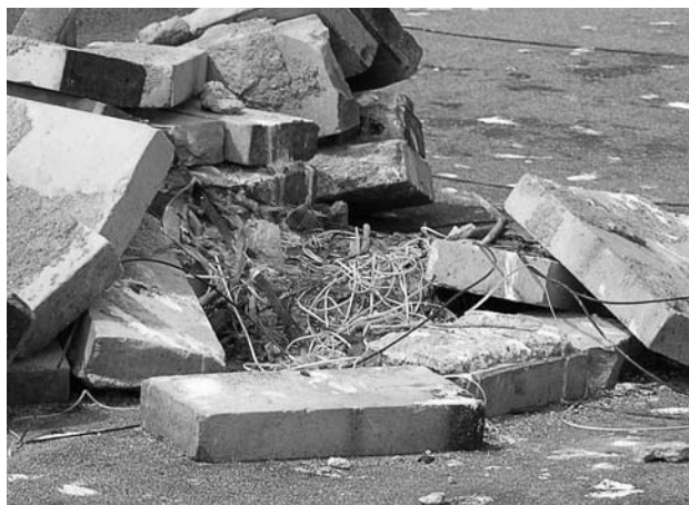
Гнездо серебристой чайки.