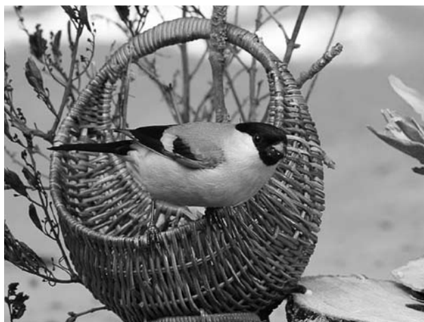
Чем закусить?

хвойные деревья. Нравятся им и городские парки Москвы, Новосибирска, Красноярска, Иркутска и многих других городов. Да и сам снегирь в это время не стремится попадаться на глаза: семейные заботы – дело тяжелое и опасное. Щегольской наряд, за который обыкновенный снегирь получил свое научное латинское название Pyrrhula pyrrhula , что означает «огненный», летом становится более тусклым. Именно в это время можно раскрыть первую тайну снегиря – секрет его яркой окраски.