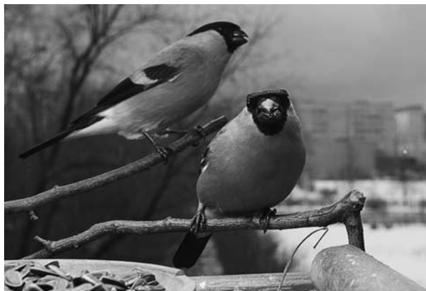
На кормушке.

Родоначальником всех современных снегирей, по видимому, является бурый или непальский «буйволовый вьюрок» (так снегиря называют по-английски). Эти птицы обитают в Южной Азии и окраской больше похожи на молодых снегирей, только что покинувших гнездо. От них произошли пять современных видов снегирей, имеющих на голове характерную «шапочку» из черных перьев. Это филиппинский (Филиппины), азорский (Азорские о-ва), серый (Восточная Сибирь и Дальний Восток), уссурийский (Дальний Восток, от Курильских и Японских островов до северной Кореи) и обыкновенный (Европа и Северная Азия) снегиря. Из всех этих видов только самцы обыкновенного и уссурийского снегирей имеют красный цвет в оперении нижней части тела и щек. Самцы других почти