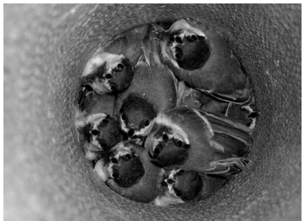
Гнездо большой синицы в трубе.

Обыкновенная овсянка ( Emberiza citrinella ) в 2008 г. построила гнездо у водонапорной башни