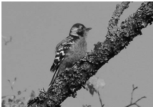
Слеток белоспинного дятла.

Белоспинный дятел ( Dendrocopos leucotos ) – редкий для Московской области вид, но на территории «Малинок» встречается достаточно часто. В 2007 г. в сосняке недалеко от р. Жилетовки была встречена пара дятлов, кормящая слетка. Они держались на