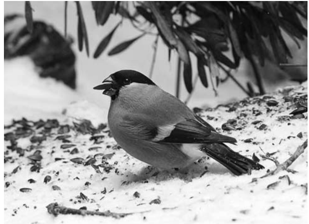
Снегирь. Самка.

Согласно библейским легендам, снегирь самоотверженно ломал иглы тернового венца с головы Спасителя, и одна капля крови попала ему на грудь, окрасив ее в красный цвет. Поэтому снегирь – охраняемая народом символическая птица. Почему Союз охраны птиц обратил внимание на птаху, состояние которой в природе не вызывает опасения? Ведь по оценкам ученых, снегирей в тайге Европейской части России гнездится довольно много – несколько миллионов. Но упускать снегиря из поля зрения, как и других обычных птиц, не стоит: известны случаи массовой контрабанды диких певчих птиц (снегирей, чижей, щеглов, овсянок), которых скрытно перевозили из нашей страны для продажи в Западной Европе, где