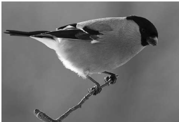
Снегирь. Самец.

Зимой снегيري откочевывают из тайги далеко на юг, вплоть до Закавказья, Ирана, Средней Азии, Средиземноморья и Великобритании. Вероятно, массовость таких «нашествий» зависит от запасов кормов в лесной зоне. Снегيري – растительноядные птицы, питаются семенами различных деревьев, кустарников, трав. В холодное время года они предпочитают семена-крылатки ясеня, ягоды рябины, плоды сирени, почки черемухи и липы. Причем они не глотают ягоды целиком, как свиристели и дрозды,